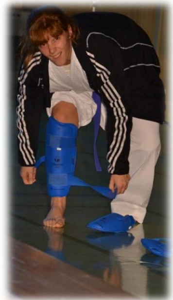
Im Bild: Vicky

Im Grand Prix Slovakia belegte Bettina im Kumite Allgemeine Klasse bis 50 kg den hervorragenden 2. Platz.