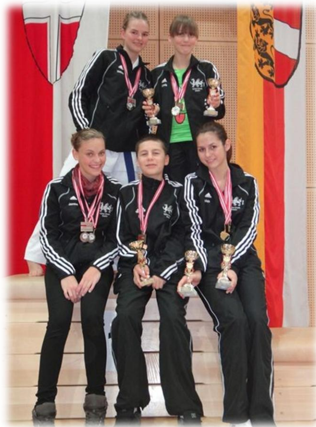
Im Bild – die erfolgreichen SportlerInnen des KC Mäders