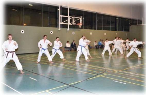
Im Bild: Erwachsene

Am Mittwoch, den 14.12.2011, fanden die Gürtelprüfungen der Erwachsenen, am 17.12.2011, die Gürtelprüfungen der Kinder statt. Die Teilnehmer der Anfängerkurse erhielten durch die Gürtelprüfung den 9. Kyu. Der 9. Kyu bildet somit den Abschluss des Anfängerkurses und den Beginn einer sportlichen Laufbahn im Karate.