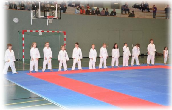
Im Bild: Kinder